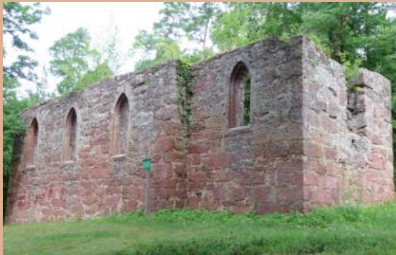
Ruine der Centgrafenkappelle aus dem 17. Jahrhundert.

Die Bodenstation in Bürgstadt liegt am Rotweinwanderweg in der überregional bekannten Lage „Centgrafenberg“.