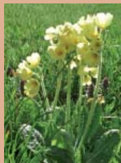
Wiesenprimel ( Primula elatior )

Der hieraus entstandene Bodentyp (Braunerde) ist im Oberboden gut mit Humus versorgt, und der im tieferen Untergrund tonige Boden garantiert eine ausreichende Wasser- und Nährstoffversorgung.